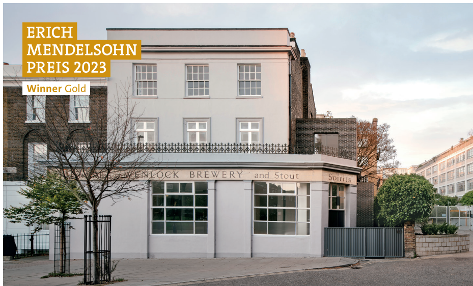
Bild- oder Flächenintegration