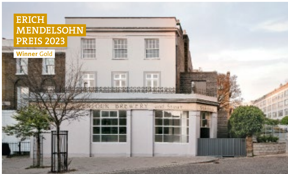
Bild- oder Flächenintegration